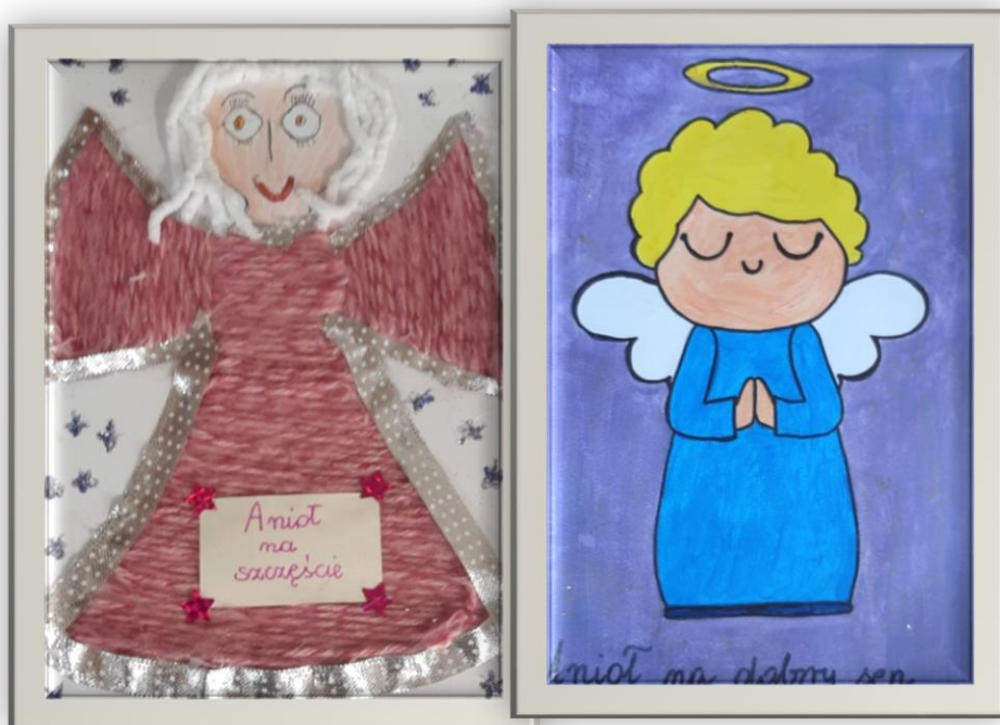
NAGRODA - Wiktoria Czerwińska